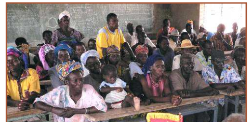
Les Parents "Vous nous avez redonné l'espoir et le courage mais nous non plus on ne dort pas.."