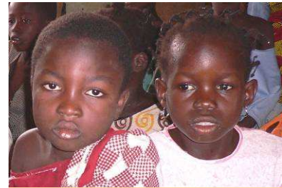
Aller à l'école un miracle permanent