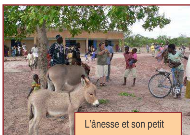
L'ânesse et son petit