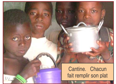
Cantine. Chacun fait remplir son plat